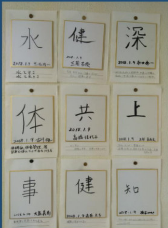
社員の今年の漢字一文字