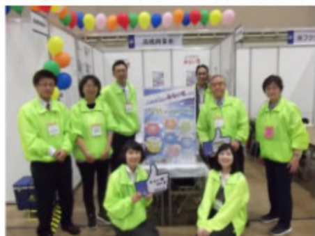
北海道みらい市 2018 7ヶ所サッポロ